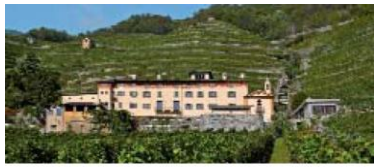
LA GATTA Valtellina