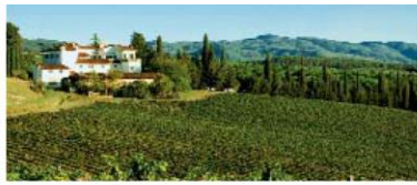
LA MADONNINA Chianti Classico