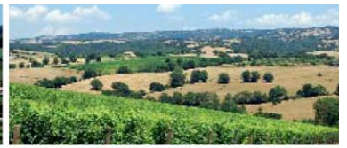
PODERE SPADINO Maremma